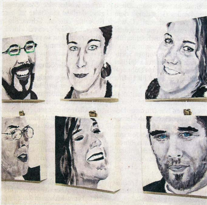
Die Kunstwerke sind sehenswert und käuflich.

Die sehenswerte Ausstellung, es können auch Bilder als „Weihnachtsgeschenk“ erworben werden, ist bis zum 12. Dezember geöffnet. Öffnungszeiten sind donnerstags von 17 bis 19 Uhr und am Samstag und Sonntag jeweils von 11 bis 18 Uhr.